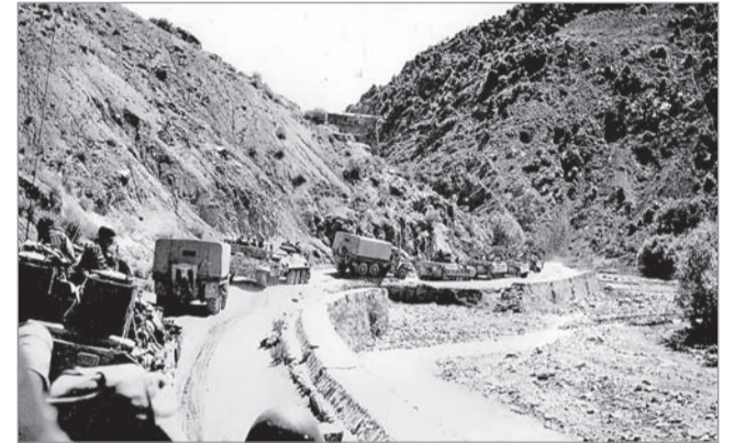
Движение советской автоколонны по горному ущелью