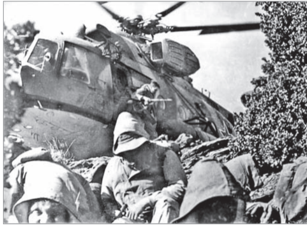
Момент десантирования на господствующую высоту с целью блокирования района