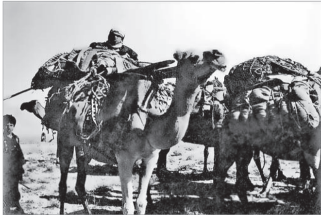
Во время досмотра каравана кочевников