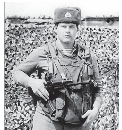
В декабре 86-го