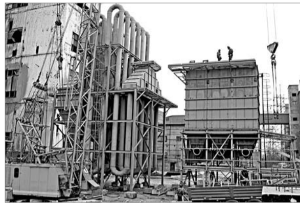
Охладитель и газоочистка будущего конвертера

Интересный момент, не связанный с производством. Шведы между делом попросили нас организовать им поход в ледовую арену «Трактор» на матч