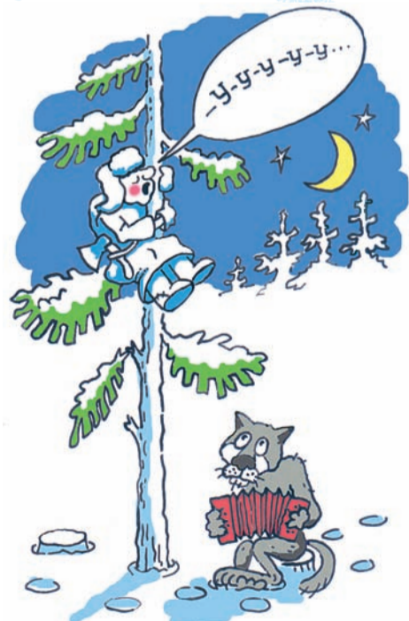
Рисунок Геннадия ЧЕГОДАЕВА

Кто-то, прочитав этот рассказ, скажет: «Чушь какая-то, брехня!». Возможно и брехня, но ведь искусство, особенно в Новый год, может творить чудеса, да и не такие. Так-то вот!