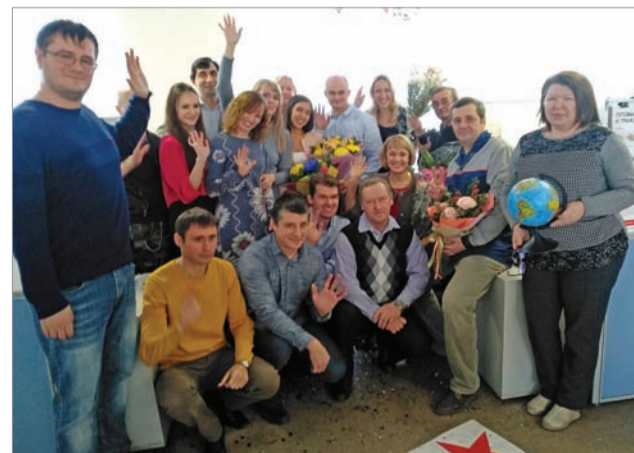
Коллектив ПКУ поздравляет своего начальника

Реальный мир преобразать – Вот ваше назначенье! А я хочу вам пожелать Работать с вдохновеньем!