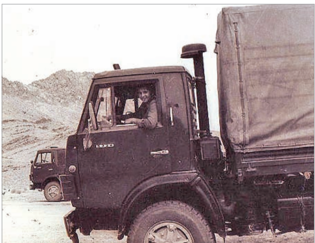
На этом КамАЗе исколесил половину Афганистана