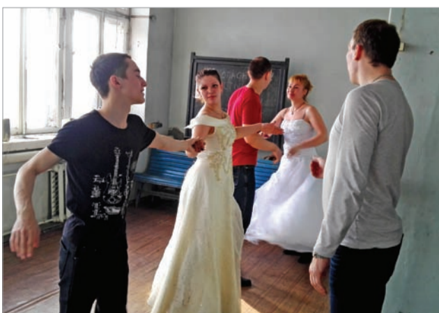
На репетиции команды 6-го цеха

Напомним, для участия в конкурсе заявляли команды второго, шестого, седьмого цехов, ПКУ, сборная «НАГАЛАМА», а также сборная профкома.