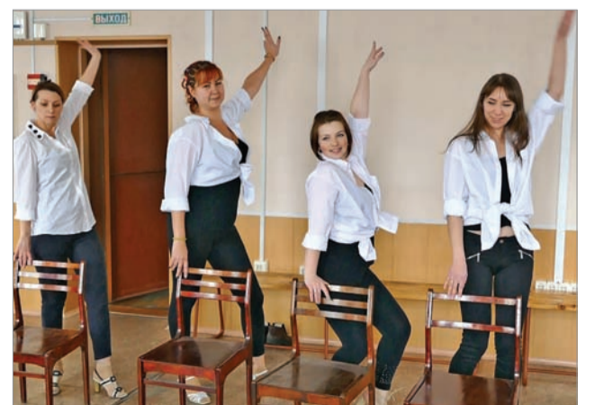
На репетиции команды ПКУ