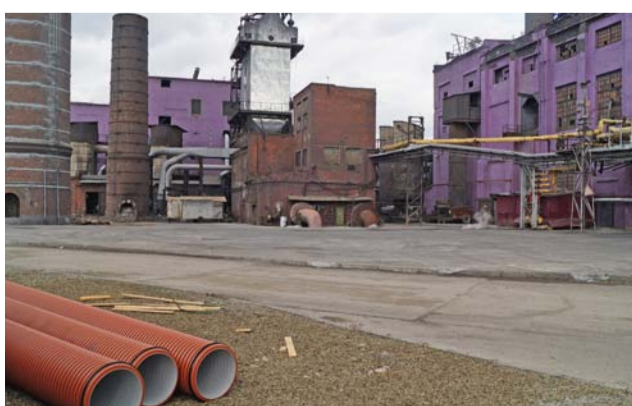
Здесь стоял пекосклад, а теперь проходит новая дорога – в объезд ЦПЭ