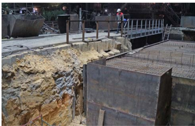
Металлоконструкция фундамента пресса Danieli

– Самые большие работы, которые предстоят, – это монтаж пресса Danieli и смесильной машины Eirich. Дальше еще одна большая работа – замена электрофильтров. Эти электрофильтры – основное газоочистное оборудование смесильно-прессового отделения. Они у нас сильно устарели (выпуск у них – 1950–1960-х годов). В данный момент проходит тендер, специалисты изучают, оценивают, какие нам нужны. Много работы, много работы! Цех большой, и везде что-то делаем. А еще сколько надо сделать!