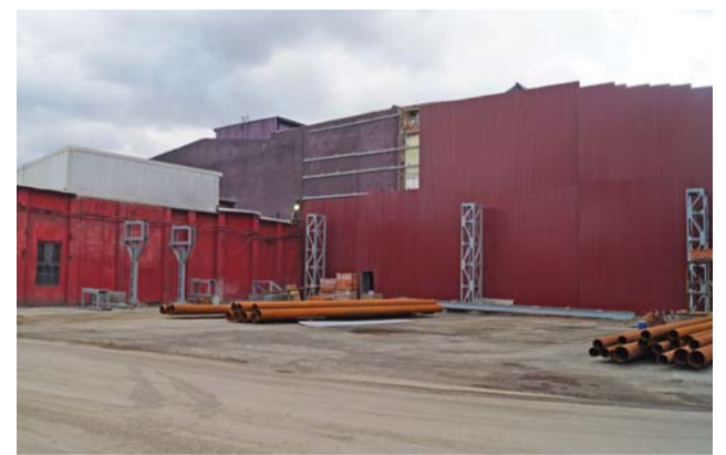
Площадка, где ранее стояло здание АБК обжигового отделения