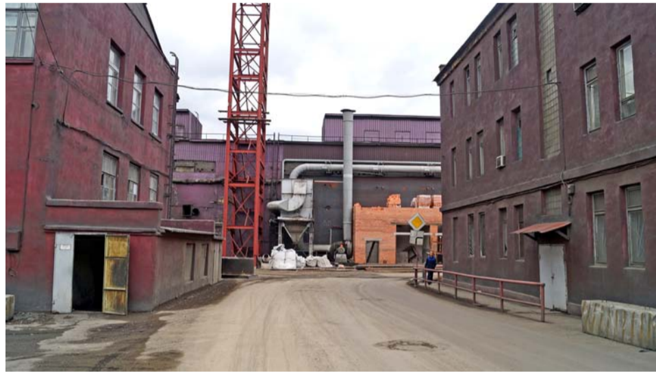
Так теперь выглядит перекресток на электродном производстве

– В этом году выполнен капитальный ремонт обжиговой печи № 4, – продолжает замначальника цеха. – Она была полностью выбрана до котлована и заново построена! На это ушло 3–4 месяца. Плюс увеличено количество камер на 3-й и на 2-й обжиговых печах: печь № 3 была 20-камерной – достро-